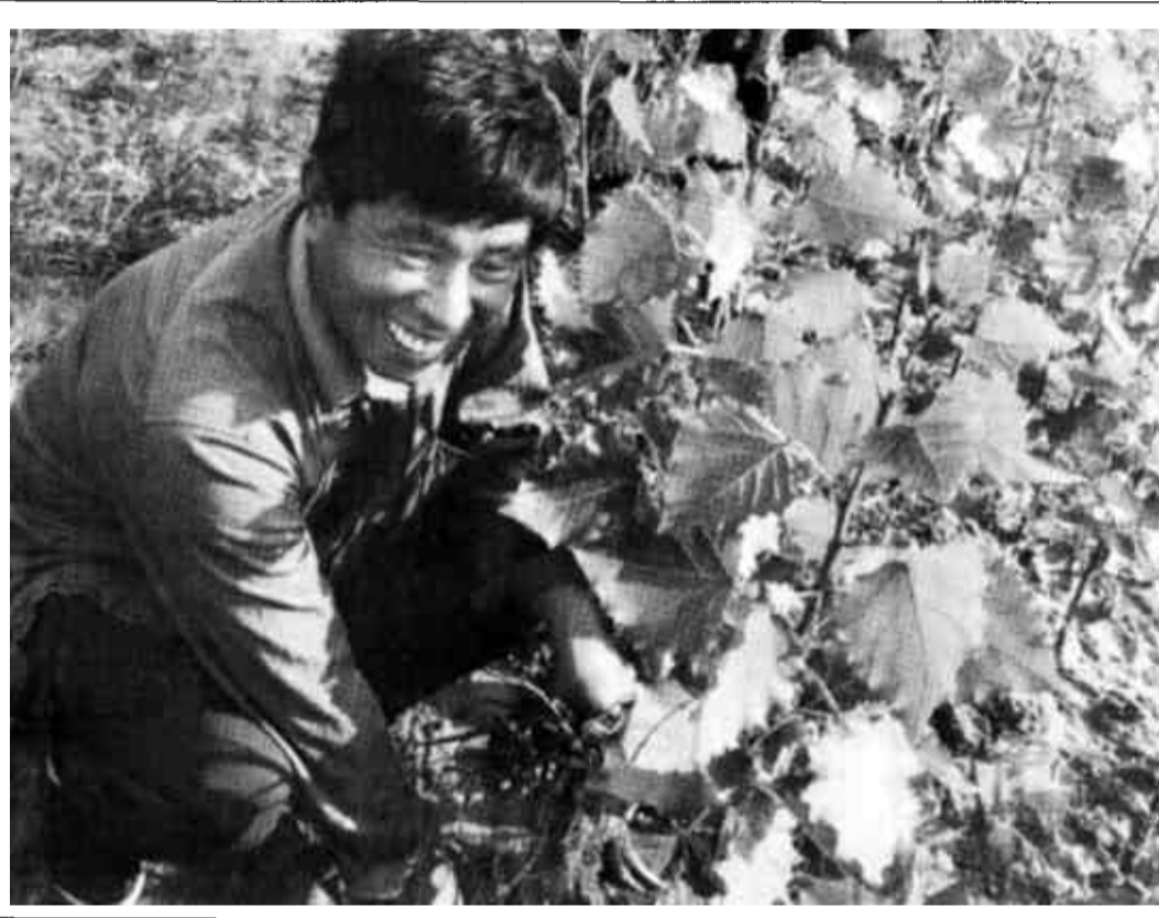
利津县立足“农业增效、农民增收”,不断加大产业结构调整,取得丰硕成果。该县经过几年艰苦努力,在培育出北宋芦笋、北岭蔬菜“绿色无公害食品”金字品牌的同时,大力发展速生林种植,目前全县已发展速生杨10000亩,并均实现了沟、渠、路、闸、涵等的配套。图为陈庄镇速生林基地的管理人员正在加强幼苗管理。