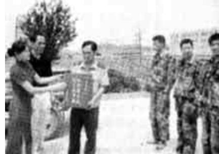
日前，东海鲜大酒店为东营区消防大队的全体官兵送去了2000斤西瓜和一台打印机，以示对消防官兵为保护人民生命财产冲锋在前、不畏“火魔”的敬意。(刘忠民 袁晓波 撰)

“不许动，你们被包围了！”早已按耐不住的巡逻队员以迅雷不及掩耳之势，一个健步将盗油贼拽了下来。“油耗子”惊魂未定，见逃跑无望，一屁股瘫软在勇猛无畏的油田卫士面前。(志峰 周江)