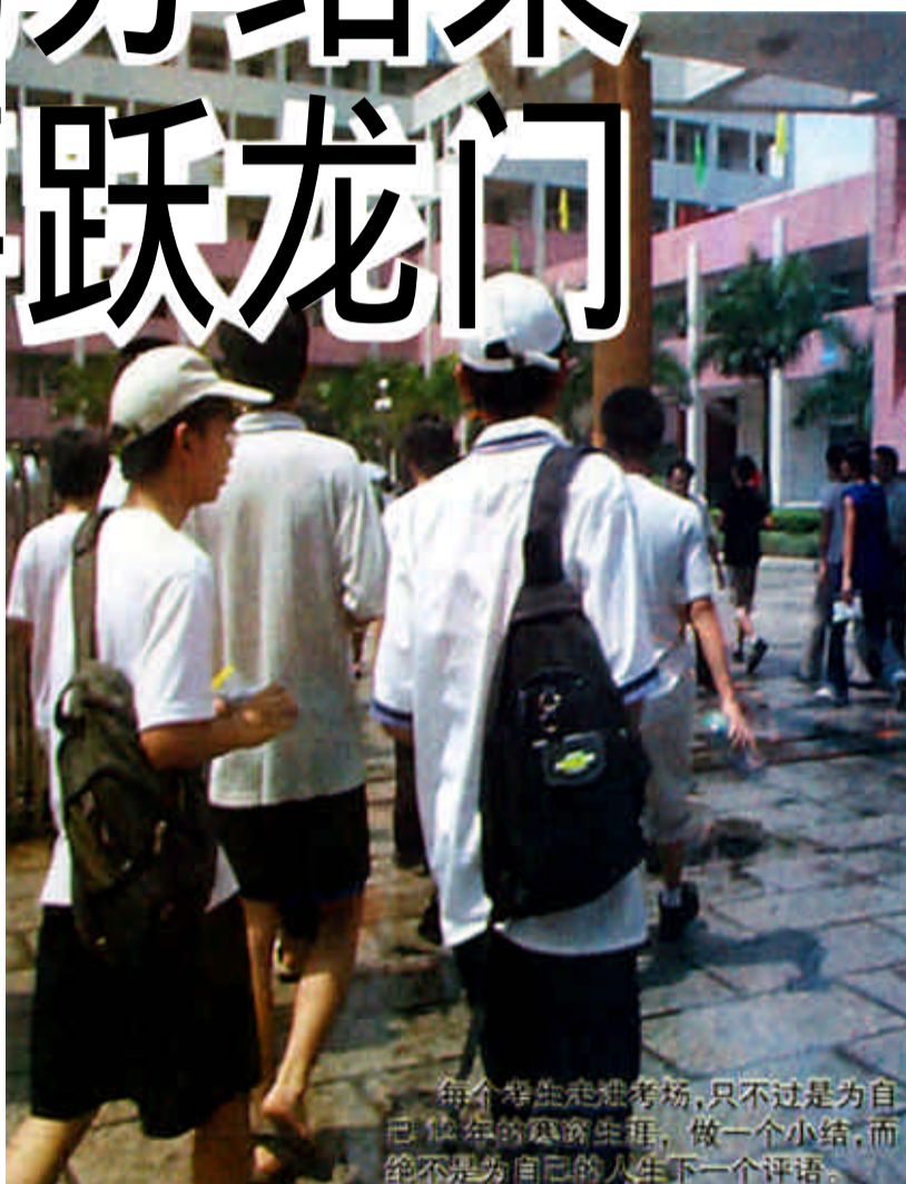
每个考生走进考场，只不过是为自己人生的竞赛生理，做一个小结，而绝不是为自己的人生下一个评语。

此外本科军检线下40分为专科（高职）军检线。体育本科分数线362分。艺术类本科最低控制线为200分，艺术类专科（高职）最低控制线为180分。对口高职本科最低控制线为562分，对口高职专科最低控制线为280分。高水平运动员统招最低控制线为280分，高水平运动员预科最低控制线为240分。